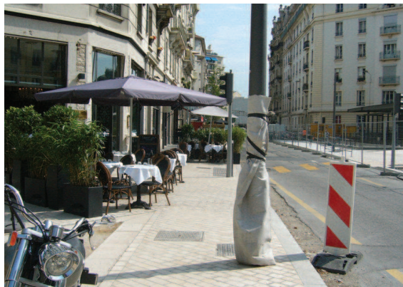
Permis de stationnement

Il est délivré par l'autorité en charge de la police de la circulation.