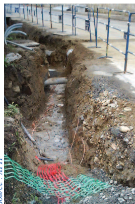
Permission de voirie

Elle est délivrée par l'autorité en charge de la ges-tion du domaine public routier, soit de façon unilatérale (arrêté), soit sur le fondement d'une convention d'occupation.